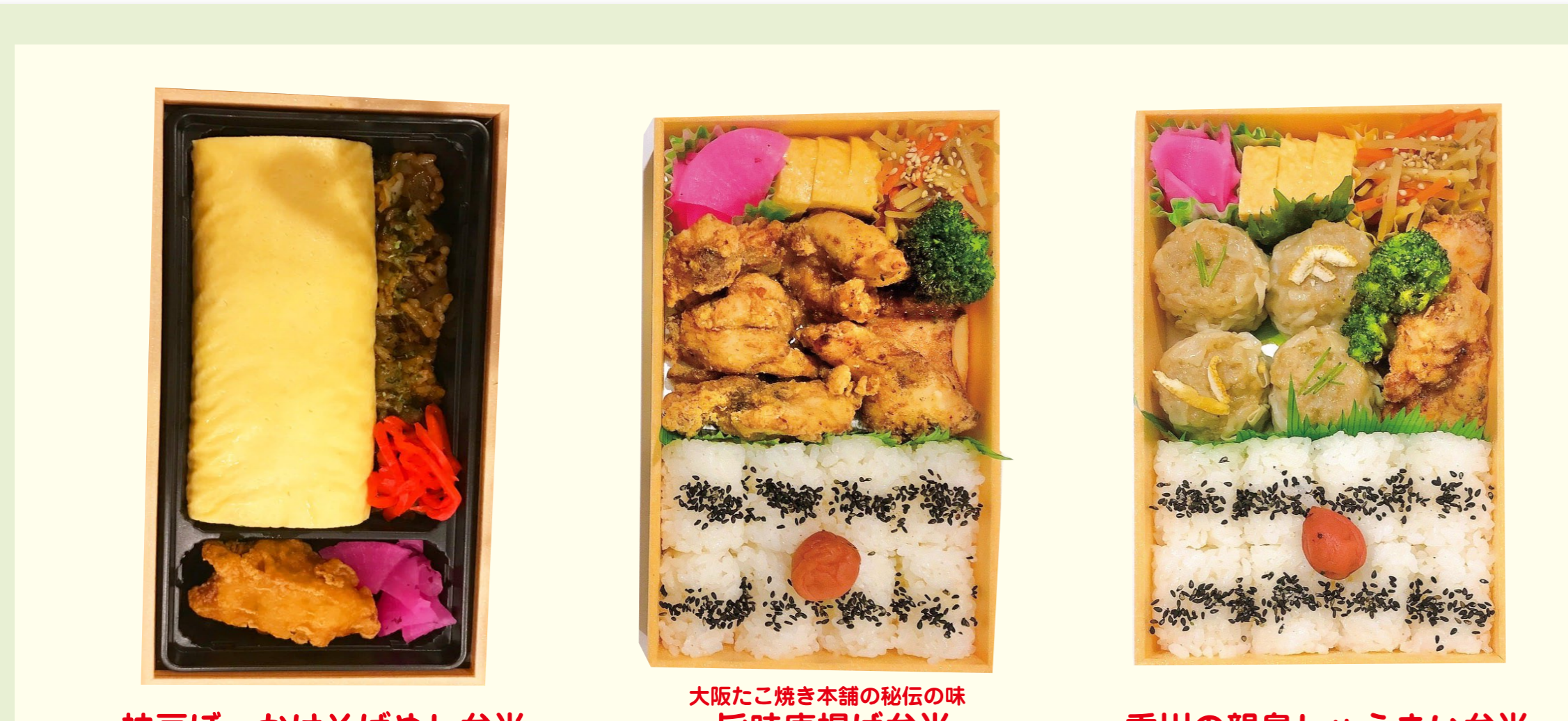
神戸ほっかけそばめし弁当